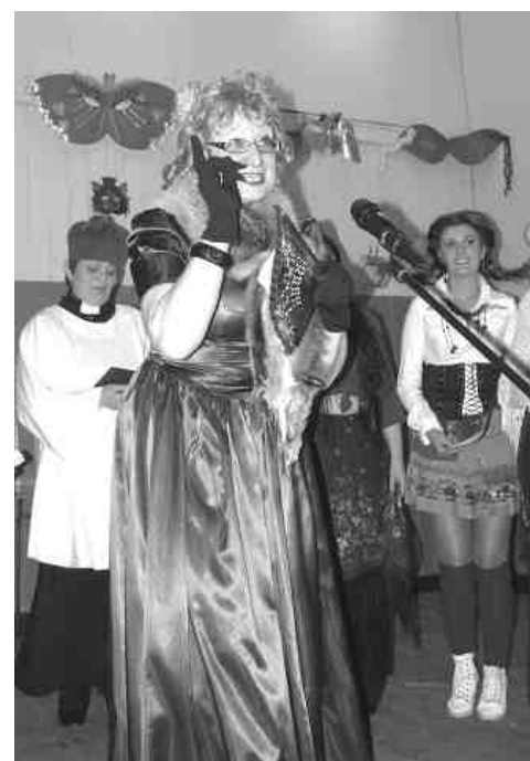
Zwycięski kabaret KGW z Luboszew gmina lubochnia